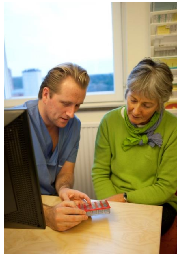
Patienten som medskapare.

Nationellt system för kunskapsstyrning Hälso- och sjukvård